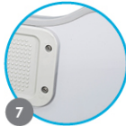
MARINE-GRADE PLYWOOD TRANSOM Tableau arrière en contreplaqué de qualité marine Travesaño de madera contrachapada de calidad marina Salzwasserbeständiges Speerholz Multiplex spiegel van maritieme kwaliteit Specchio di poppa in compensato marino Pawęż ze sklejkii wysokiej jakości