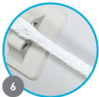
WRAPAROUND GRAB CORD Ligne de vie Cable de agarre envolvente Griffband zum umbinden Omwikkelde grijpkoord Corda per afferrarsi arrotolata Lina wokół do chwytania