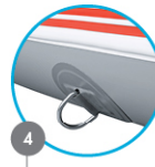
HOOK Crochet Gancho Haken Haak Gancio Hak