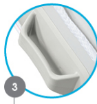
SIDE GRIPS Poignées latérales Asas laterales Seitliche griffe Zijgrepen Impugnatura laterali Uchwyty boczne